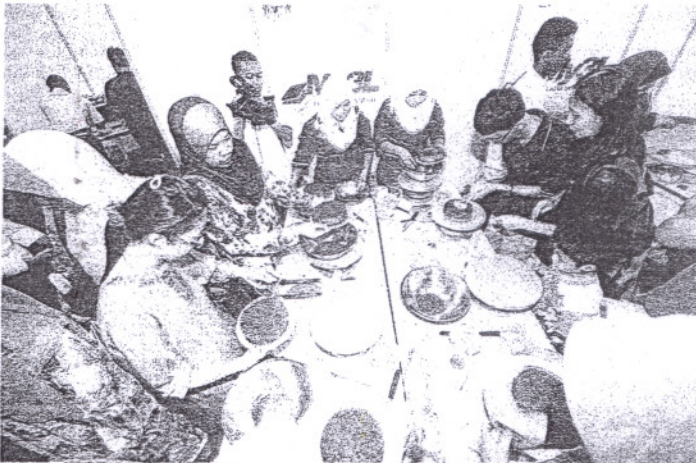
Sebahagian daripada pelajar dan masyarakat yang menyertai Program MY3L Kementerian Pendidikan di Kuala Lumpur, baru-baru ini.