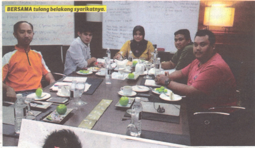
BERSAMA tulang belakang syarikatnya.

“Sampai satu ketika, kami berdua terpaksa mencatat makanan dan wang perbelanjaan. Melihat keadaan itu, suami menyarankan saya melanjutkan pengajian ijazah kedua da-