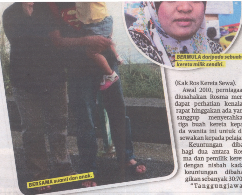
BERMULA daripada sebuah kereta milik sendiri.