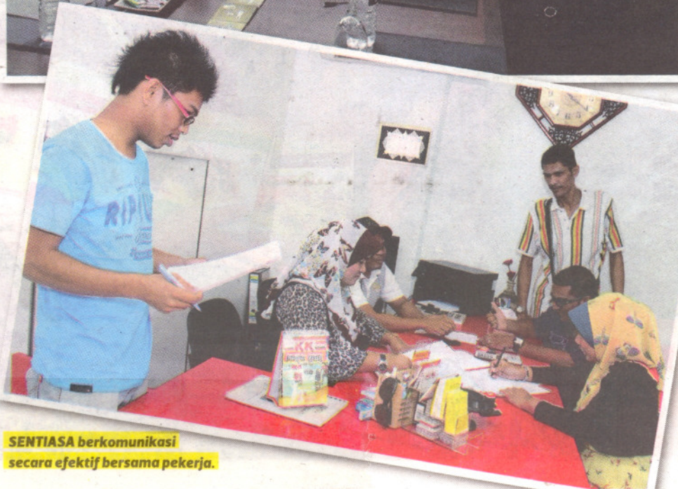
SENTIASA berkomunikasi secara efektif bersama pekerja.