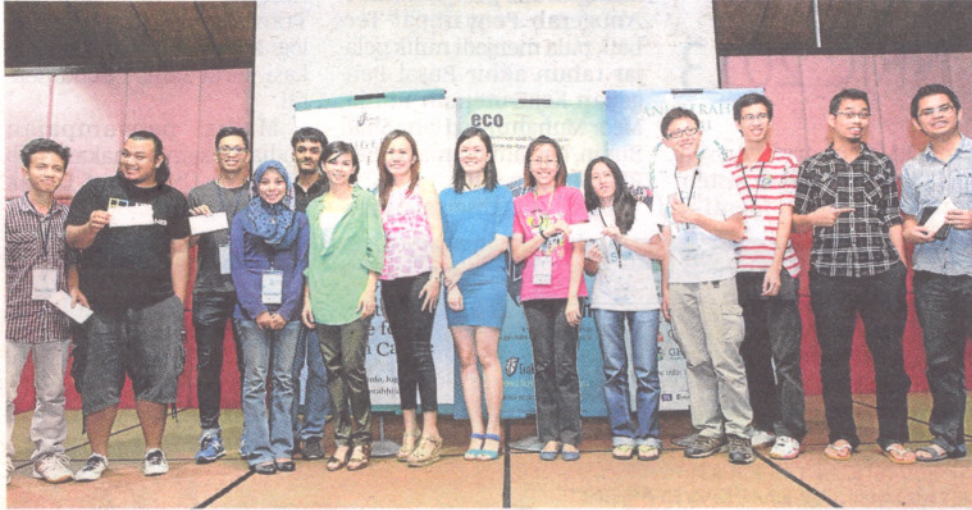
Sepuluh finalis yang menghadiri bengkel bersama-sama wakil LBS

Dengkil: Seramai 10 finalis pertandingan Anugerah Hijau menghadiri bengkel ciptaan ruangan rekreasi menggunakan bahan kitar semula di Paya Indah Wetlands baru-baru.