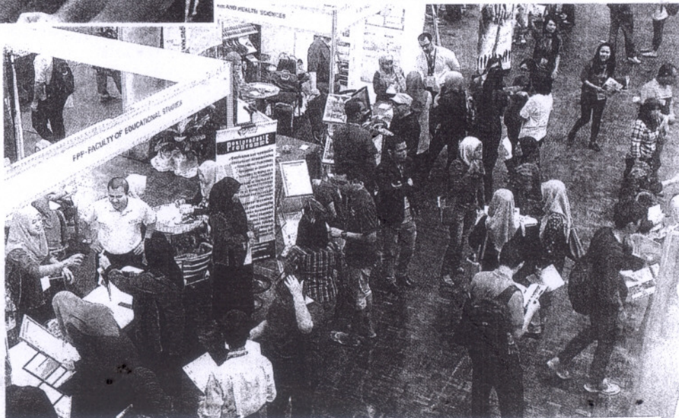
LinkedIn mengundang graduan, golongan profesional menjadi ahli.

Program itu memberi penerangan kepada bakal pelajar dan orang awam mengenai pelbagai program pascasiswazah di UPM dan prospek kerjaya.