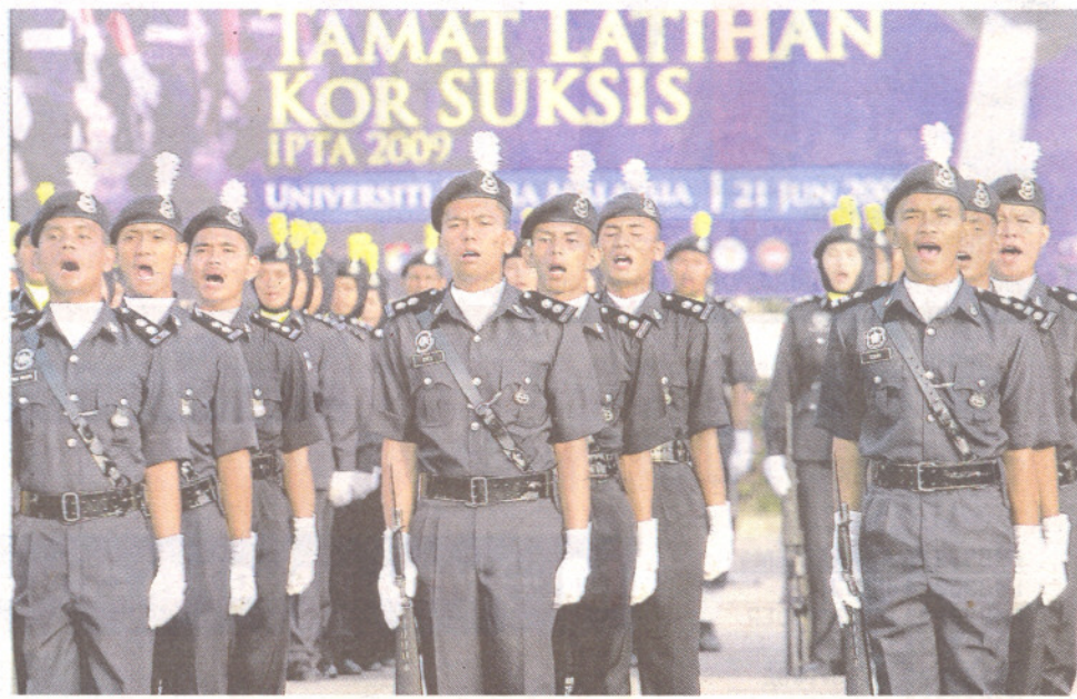
SEGAK...sebahagian pelatih ketika Majlis Istiadat Tamat Latihan dan Pelantikan Kor Suksis IPTA 2009, semalam.