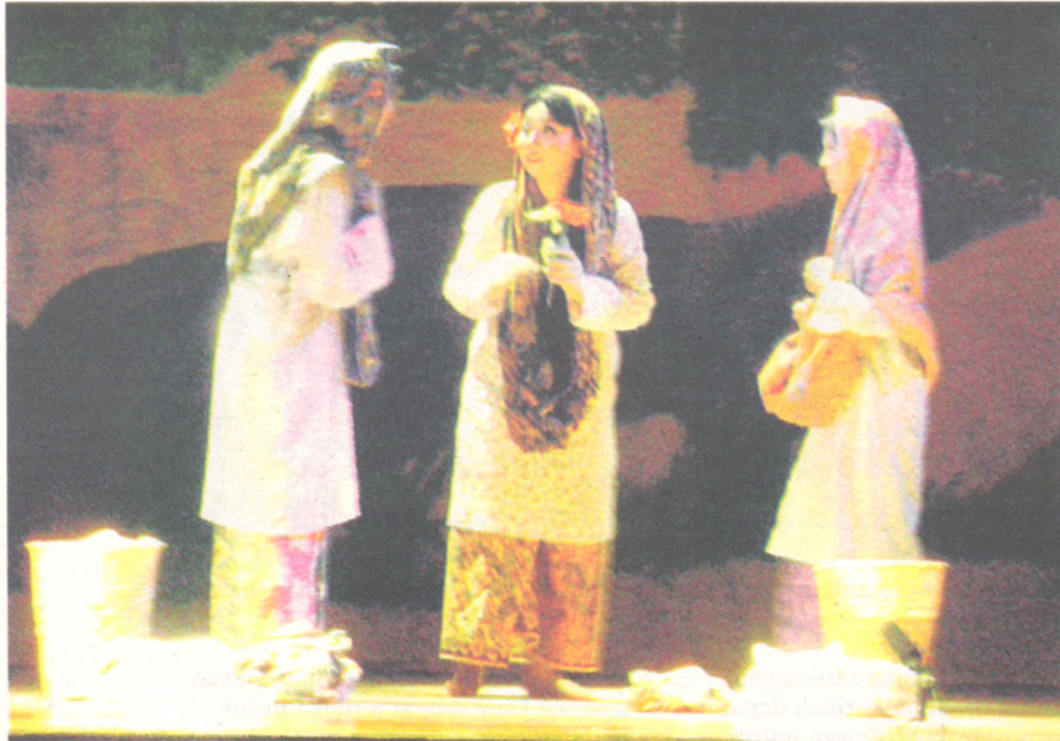
SALAH satu adegan dalam pementasan Si Bongkok Tanjung Puteri di Panggung Percubaan, PKKSSAAS, UPM, Serdang baru-baru ini.