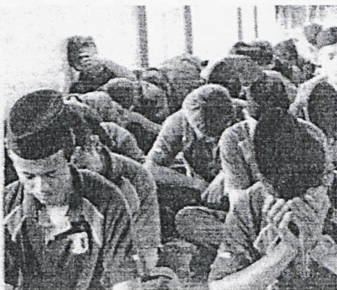
PROGRAM motivasi penting untuk mendidik jiwa. – Gambar hiasan