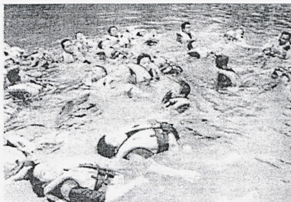
PELAJAR akan lebih yakin diri selepas mengikuti program motivasi. – Gambar hiasan