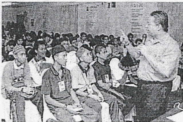
PROGRAM motivasi kini sering diadakan walaupun bukan semasa cuti persekolahan. – Gambar hiasan