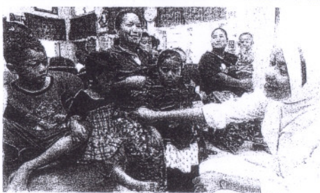
Penduduk Orang Asli mendapat rawatan perubatan di klinik kesihatan.

mendapat hasil daripadanya," katanya sambil menambak pendapatan penduduk boleh mencecah RM1,000 ketika harga getah mahal. Beliau berkata, langkah kerajaan membuka tanah bagi menanam getah untuk menambak ekonomi penduduk amat dialu-alukan kerana ramai penduduk keluar kampung untuk mencari pekerjaan kerana pialang kerja di kampung terhad. "Penduduk menggunakan jeti di Empangan Temenggong untuk ke jeti Trojan sebelum ke Pekan Gerik untuk berurusan di pejabat kerajaan atau membeli-beli. Kami jarang menggunakan laluan balak untuk keluar ke pekan Sungai Siput di Ipoh," katanya. Stasiun di kampung berkenaan cukup menarik, selain bersih dan teratur, penduduknya cukup ramai, malah kunjungan penulis bersama penyelidik Universiti Putra Malaysia (UPM) dan Kelab Pacuan Empat Roda Selangor baru-baru ini, turut dihidangkan dengan durian dan buah-buahan tempatan. Empangan Temenggong yang menjana bekalan elektrik untuk negara turut bersumbangkan laluan sungai, iaitu Sungai Temenggong merentasi kampung ini. Airnya yang bersih dan sejuk cukup menyeronokkan bagi mereka yang berkelah dan mandi mandi. Namun, untuk sampai ke Pos Kemar bukan sesuatu yang mudah, perjalanan dari Sungai Siput ke penempatan itu melalui jalan balak yang berdebu cukup menyeronokkan, hanya pemandu kenderaan yang benar-benar lajak dan berpengalaman saja mampu mencecahnya.