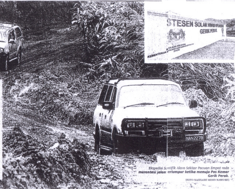
Ekspedisi Sertifik Alam Sekitar Pacuan Empat roda merentasi jalan erlumpur ketika menuju Pos Kemar Gerik Perak.

Penempatan Orang Asli suku Temiar kini dilengkapi pelbagai kemudahan