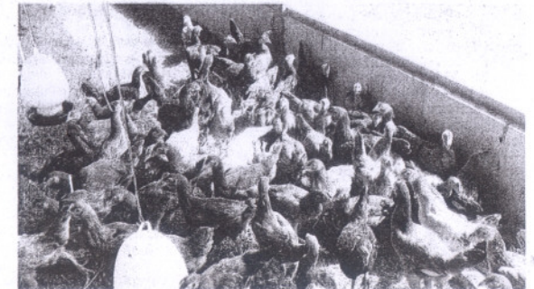
MEMERANGI penyakit sampar ayam (ND) penting bagi memastikan industri tersebut terus berkembang pesat.

"Semua anjing di kawasan ini diwajibkan diberi pelarian Rabies dan dilesenkan di Pejabat Veterinar Daerah berkenaan. Bagi lain-lain kawasan, pelesenan anjing dilaksanakan oleh pihak berkuasa tempatan (PBT) atau Pihak Berkuasa Veterinar negeri," katanya.