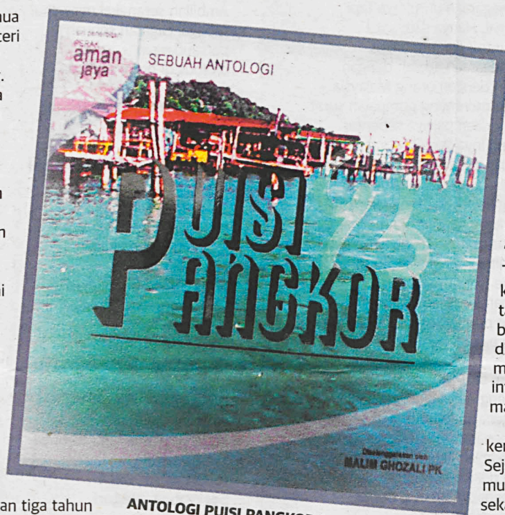
ANTOLOGI PUISI PANGKOR 2.

menyebut, "Edisi kali ini diadakan dalam skala yang lebih besar berbanding tahun lalu. Ini disebabkan sambutan baik yang ditunjukkan oleh kalangan penyair dan penggiat lagu rakyat serta sambutan menggalakkan daripada khalayak."