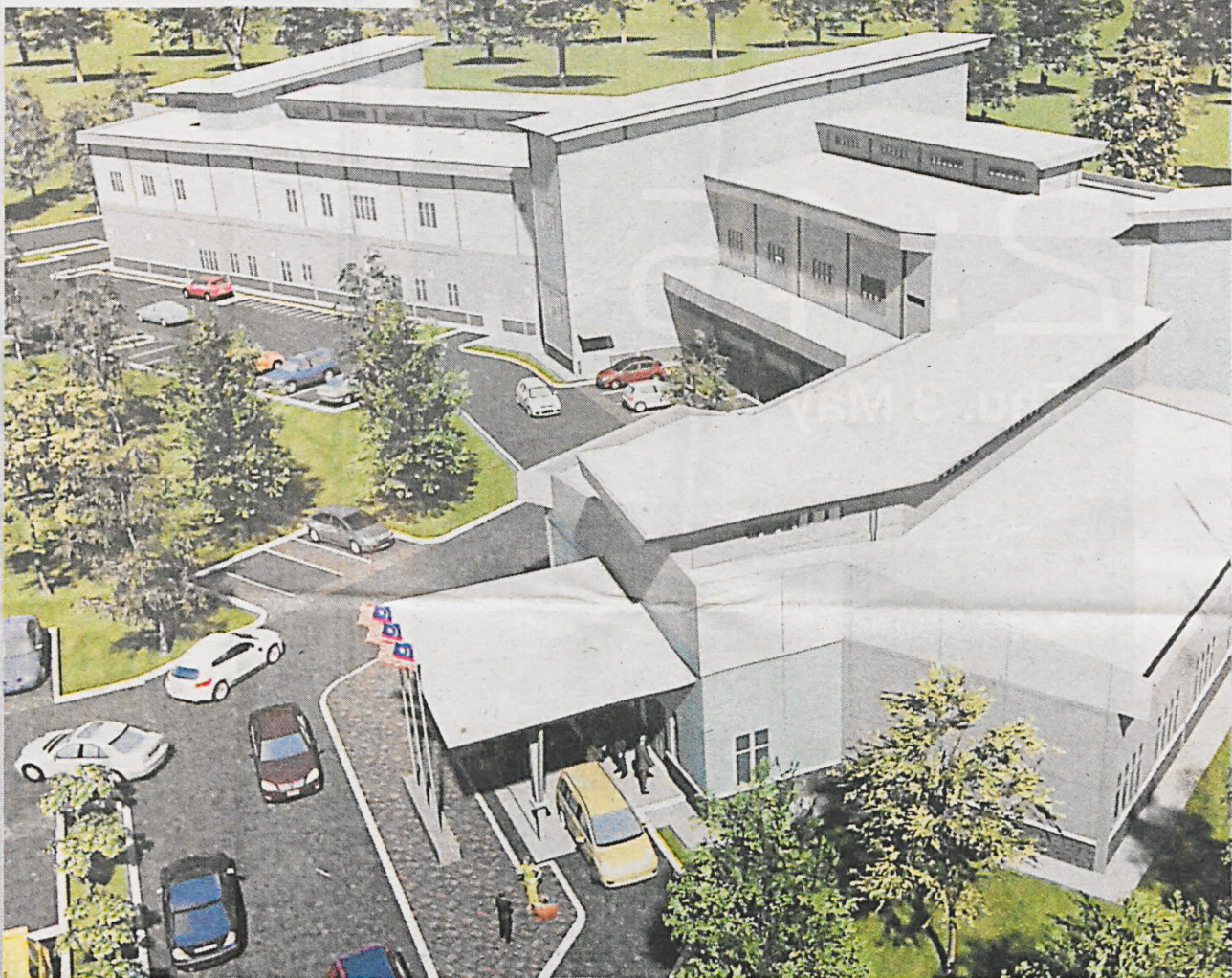
Model bangunan Makmal Analisis Halal JAKIM di Bandar Enstek.