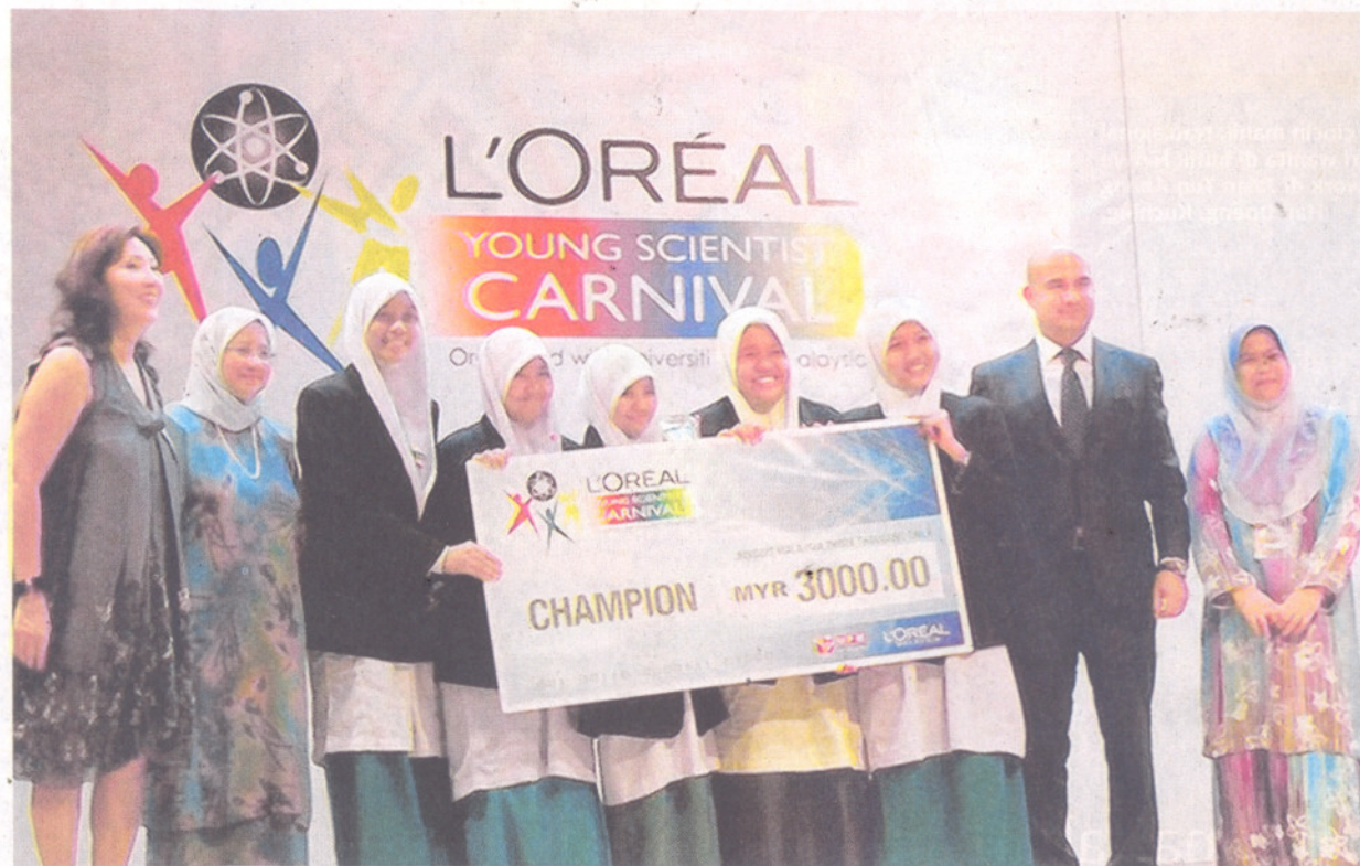
PASUKAN Sekolah Agama Menengah Tinggi Sultan Hishamuddin meraikan kejayaan mereka selepas diumumkan juara pertandingan L'oreal Saintis Muda di UPM Serdang, Selangor baru-baru ini.

Tempat kedua pertandingan itu disandang Sekolah Menengah Kebangsaan (SMK) Tengku Ampuan