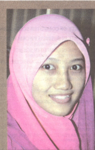
AIN MAWARNIN... beri kepercayaan.