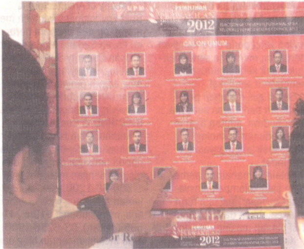
PILIHAN SAYA... mahasiswa berhak diberi peluang untuk memilih calon pilihan tanpa dipengaruhi orang luar.

"Parti diwakili bukan jaminan kukuh mereka boleh mengemudi dengan baik, justeru tunjukkan kewibawaan sebenar sebagai seorang pemimpin yang dipercayai," katanya.