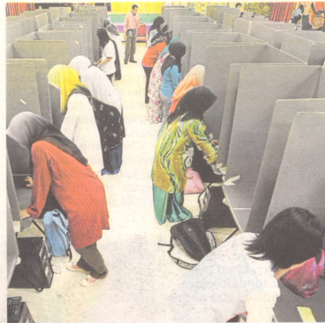
Pelajar UPM mengundi secara e-voting.

"Mahasiswa sepatutnya faham dan sedar terhadap limitasi yang ditetapkan ke atas mereka sepanjang proses PRK. Bagaimana mereka ingin menjadi pemimpin jika jati diri seorang pemimpin tidak ditonjolkan dalam diri masing-masing.