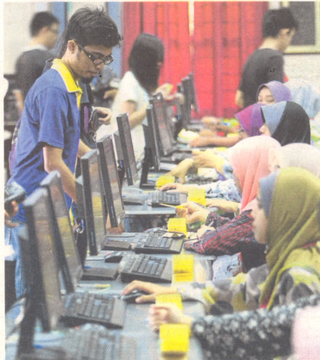
Pelajar UPM membuat semakan nama sebelum mengundi.

dikategorikan dalam kelompok awal dewasa dan mereka masih mencari identiti diri sebenar dan jika jati diri mereka terarah kepada sesuatu yang bersifat negatif, tidak mustahil mereka akan bertindak sesuatu di luar batasan.