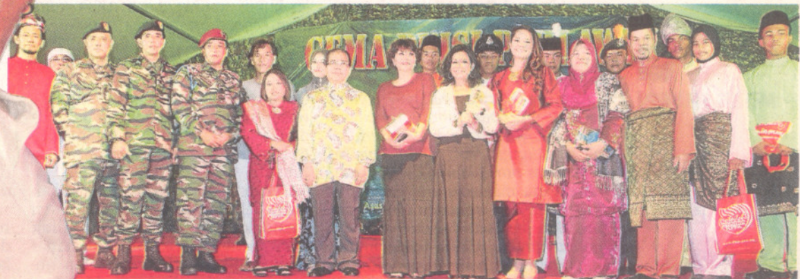
Peserta yang mengambil bahagian pada Gema Puisi Pahlawan sempena Hari Pahlawan dan Hari Malaysia 2012 di Port Dickson, Negeri Sembilan.

Keamanan negara sangat berharga tidak terbeli walau dengan emas