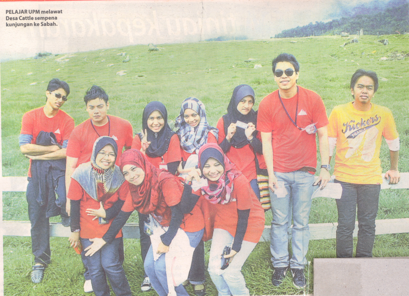
PELAJAR UPM melawat Desa Cattle sempena kunjungan ke Sabah.