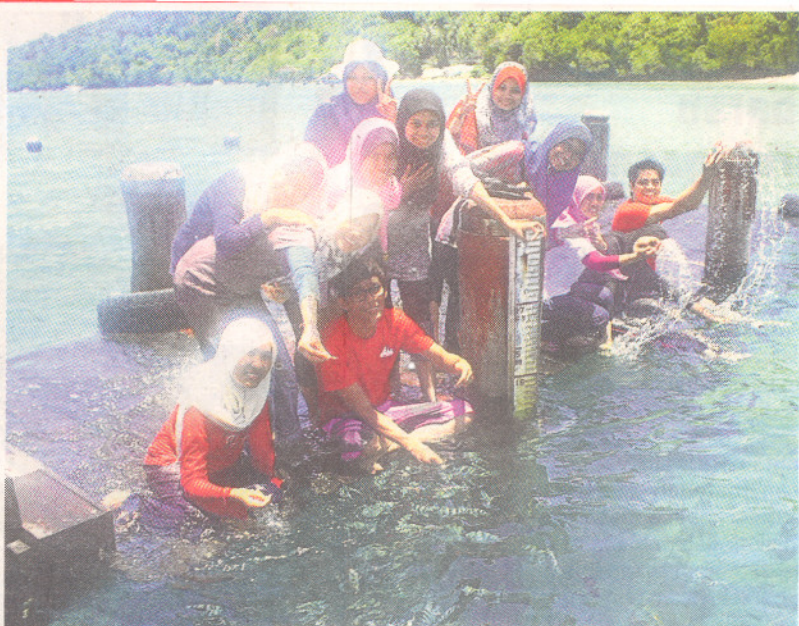
PELAJAR UPM menerokai keindahan lautan jernih di Pulau Manukan.

kebanyakan peserta yang pertama kali menjejakkan kaki di Sabah selain menghubungkan silaturahim, mahasiswa UPM dan UMS yang sebelum ini tidak mengenali antara satu sama lain.