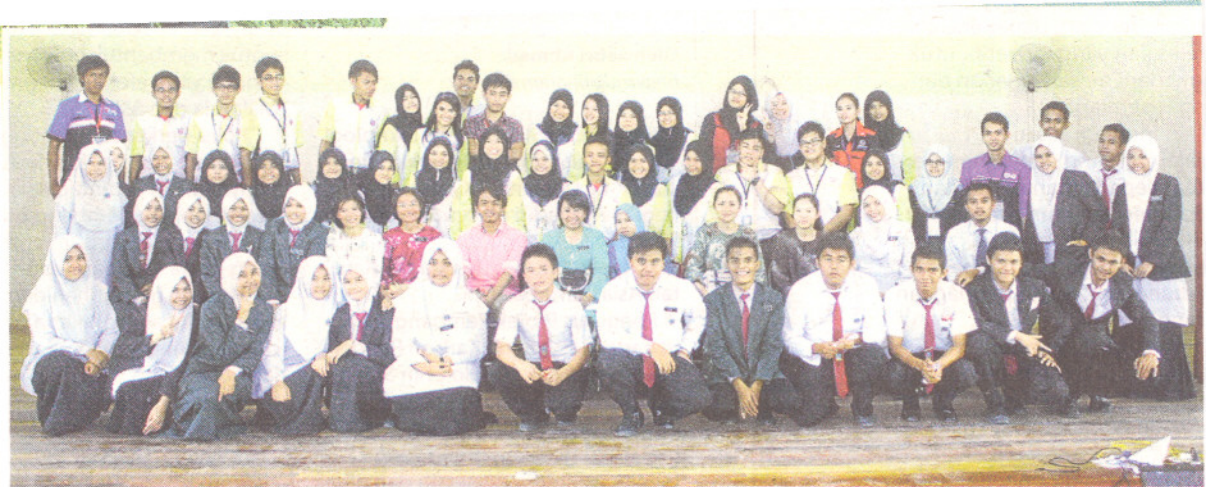
PROGRAM motivasi pelajar antara pengisian Kembara Borneo Mahasiswa UPM ke Negeri Di Bawah Bayu.