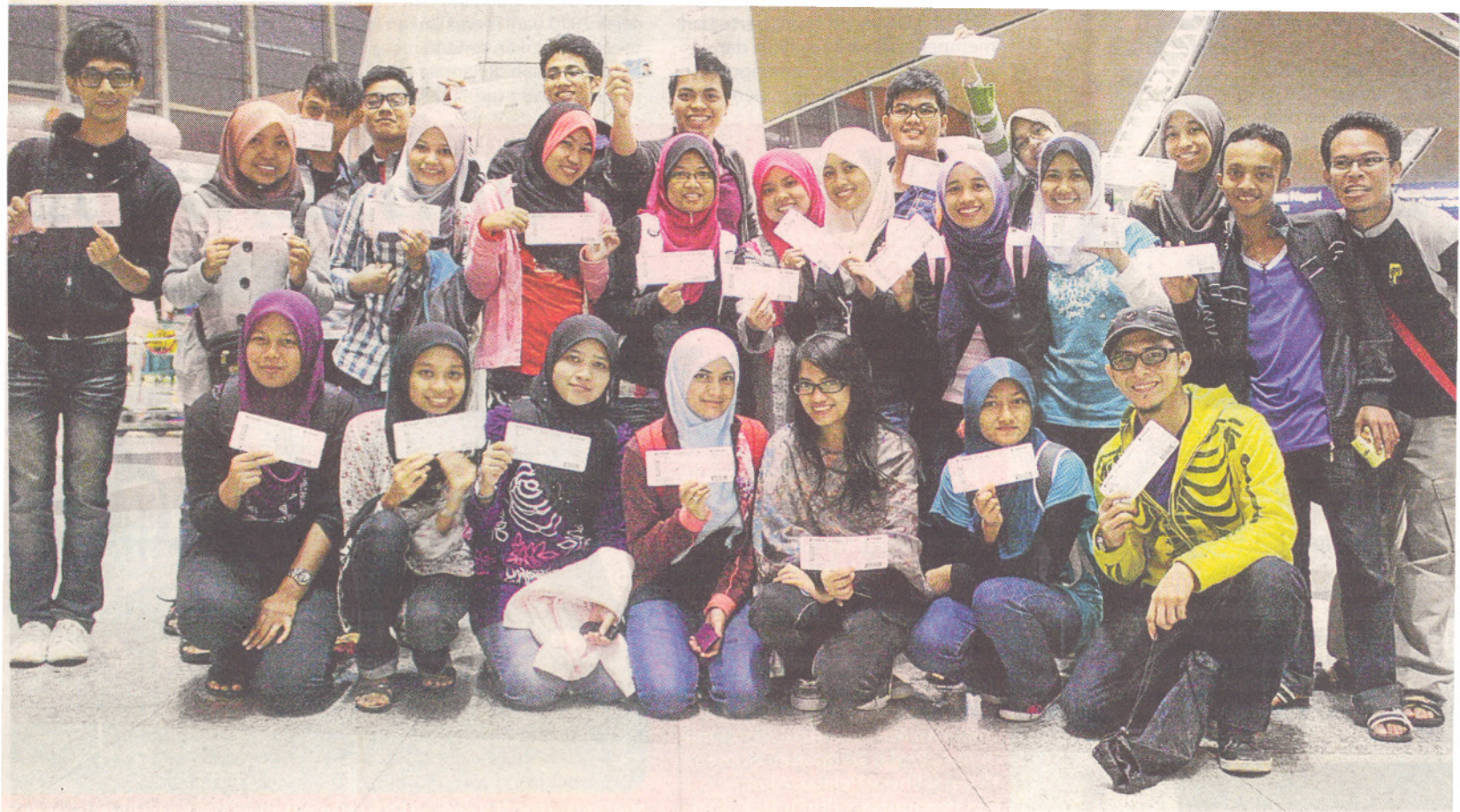
PROGRAM motivasi pelajar antara pengisian Kembara Borneo Mahasiswa UPM ke Negeri Di Bawah Bayu.