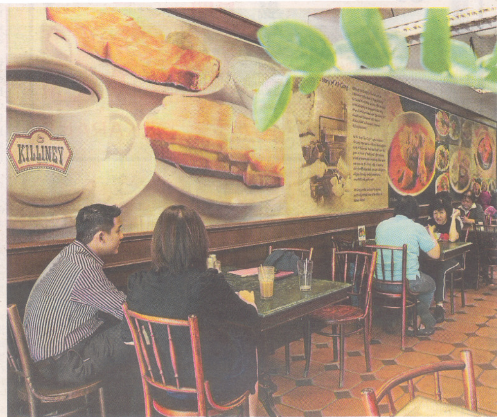
PELBAGAI menu disediakan untuk pelanggan Killiney Kopitiam.

Kopi Killiney Kopitiam diadun daripada pelbagai jenis biji kopi untuk mem- berikan rasa istimewa dan aroma tersendiri. Kami cadangkan anda cuba secawan hari ini.