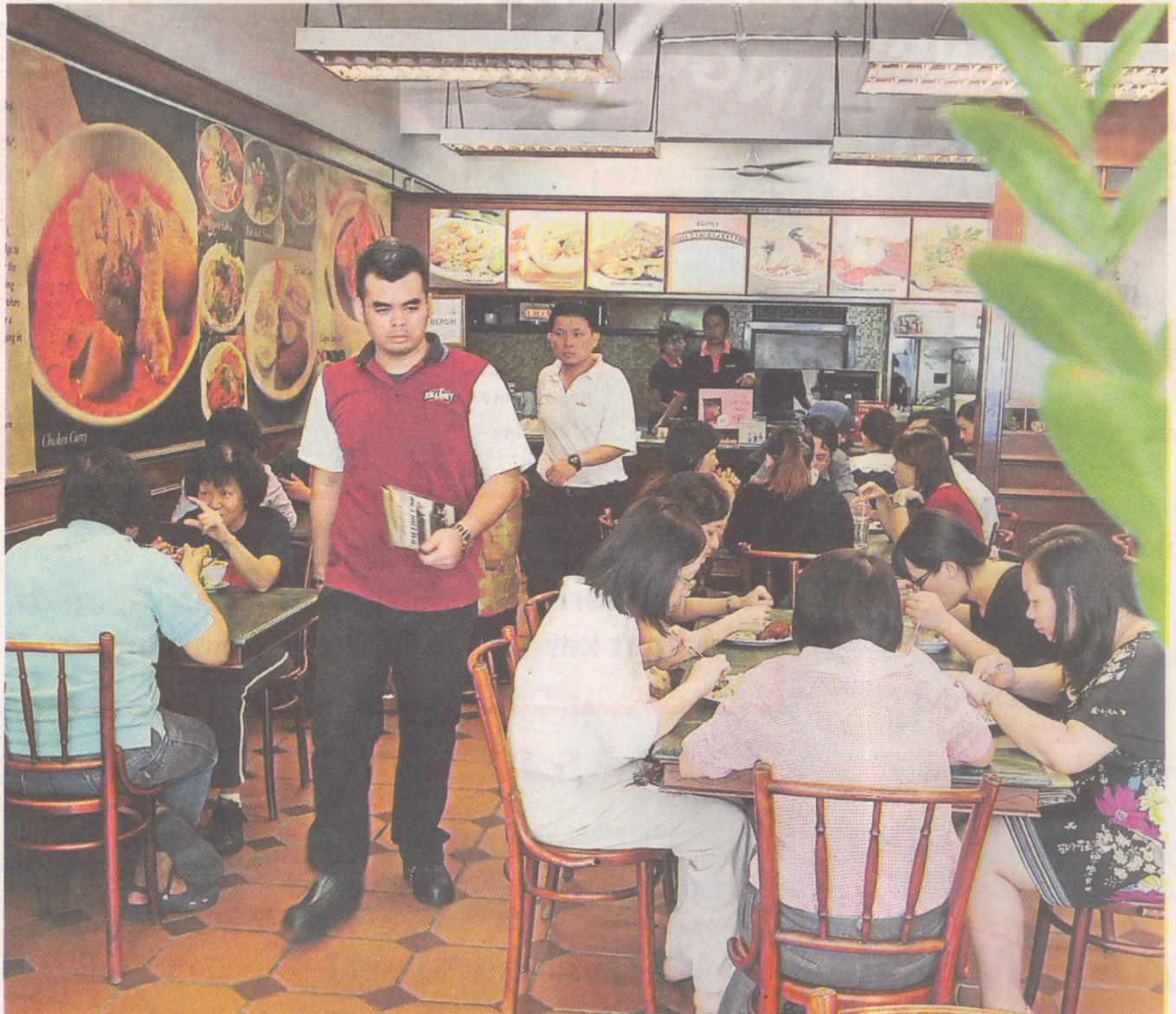
ORANG ramai menjamu selera di Killiney Kopitiam.

Beliau juga turut bertanggungjawab membantu