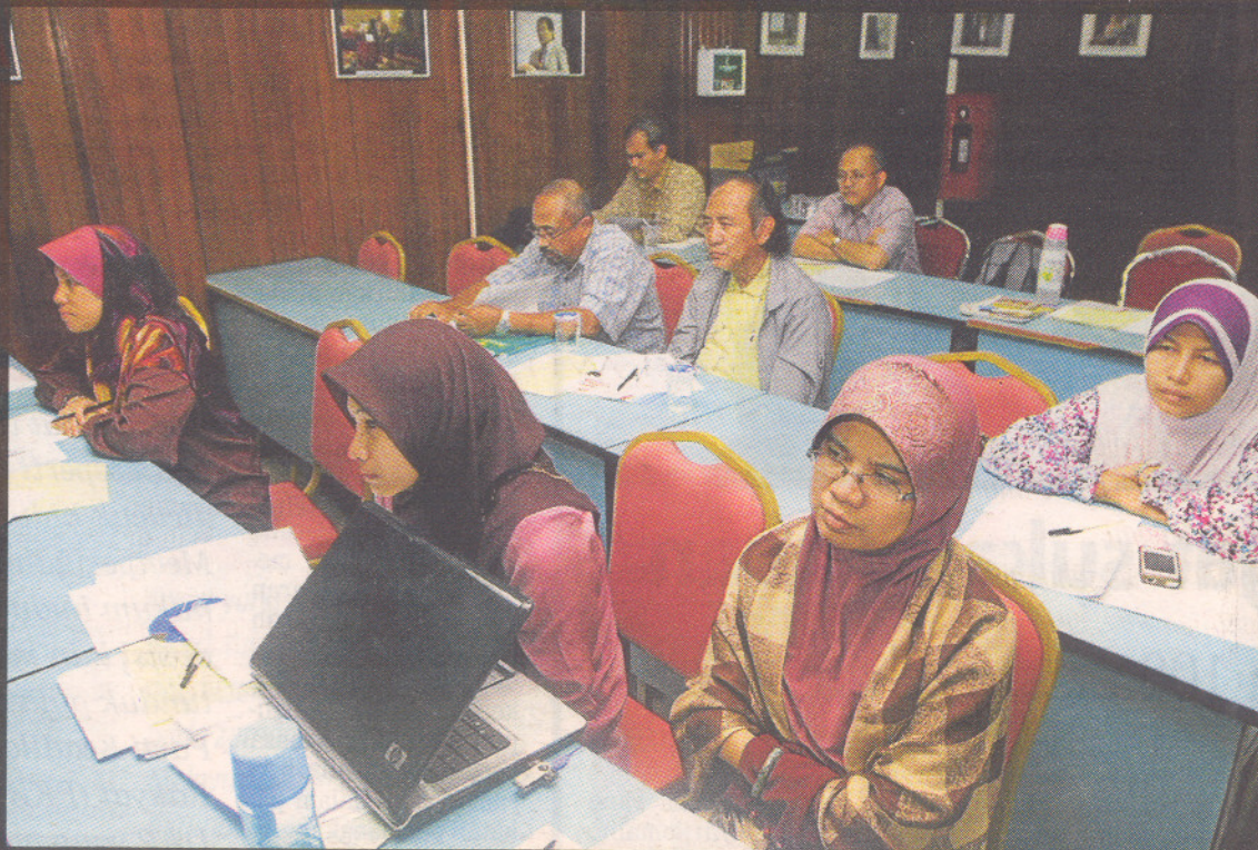
KHALAYAK pada Seminar Aspek-Aspek Keilmuan Etnomatematik Tamadun Melaka di Universiti Putra Malaysia.

tung kepada perahu asing, tidak bermakna perahu alam Melayu bersaiz kecil dan tidak mampu meredah lautan mungkin benar pada tempat tertentu saja.