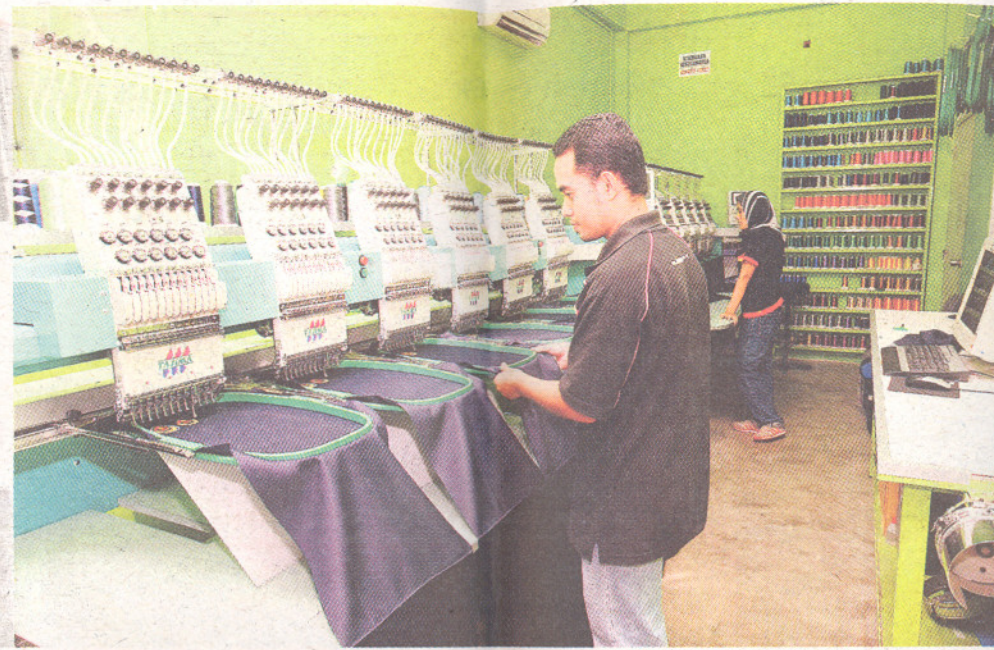
KAKITANGAN yang menjadi tulang belakang syarikat tekun bekerja.