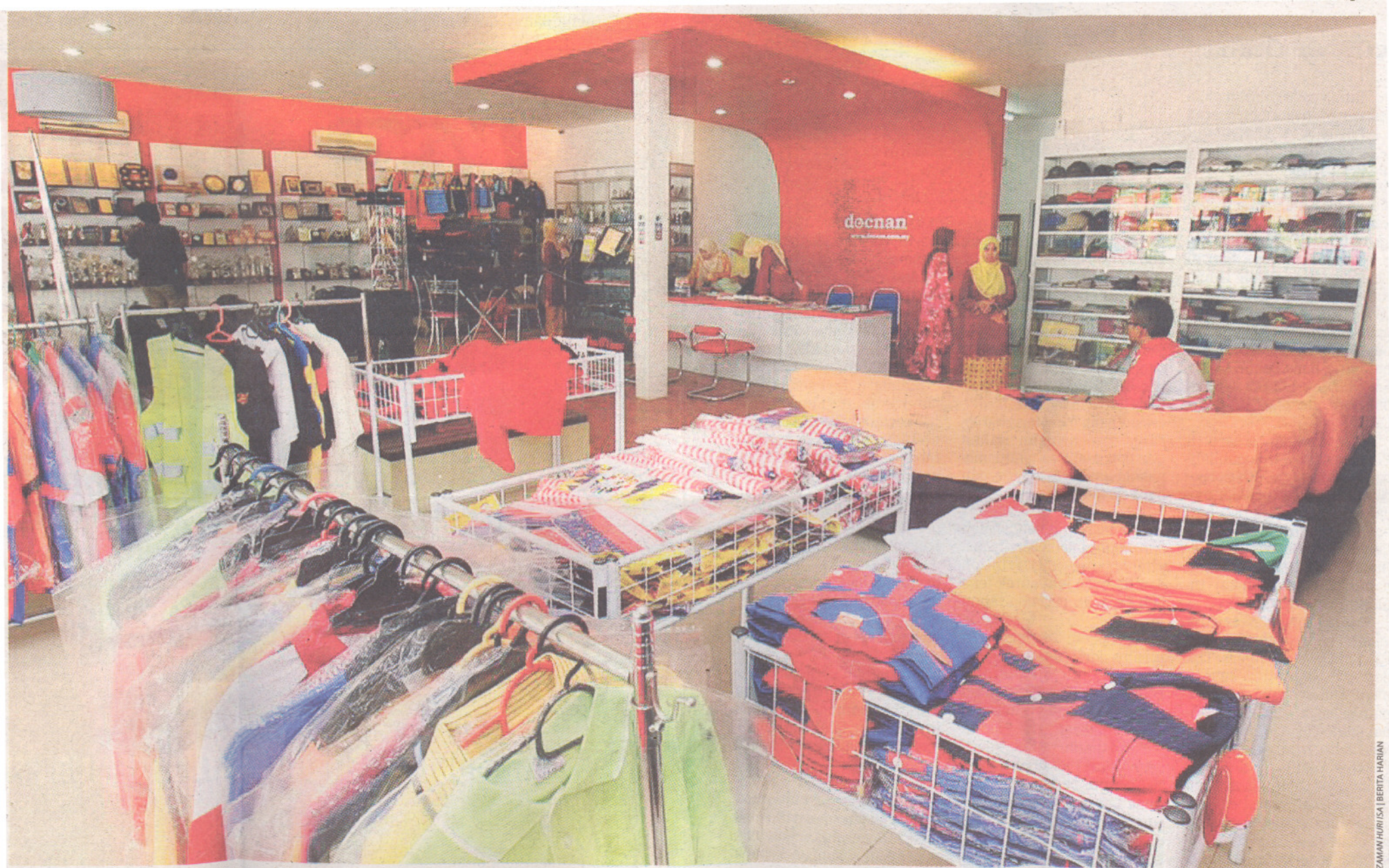
KEDAI cenderamata Decnan bertempat di Jalan Pengkalan Chepa.