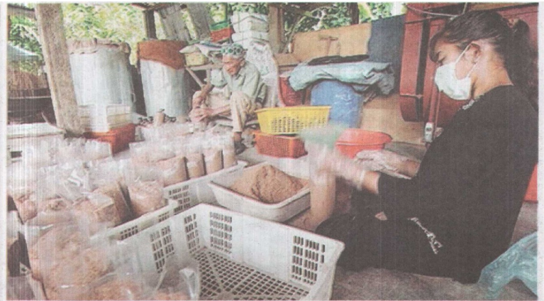
TUGASAN mengisi media ke dalam polibeg dilakukan oleh pekerja yang mahir.

sambilan dan dibantu oleh ahli keluarga, Zainon memulakan tugas seawal lapan pagi.