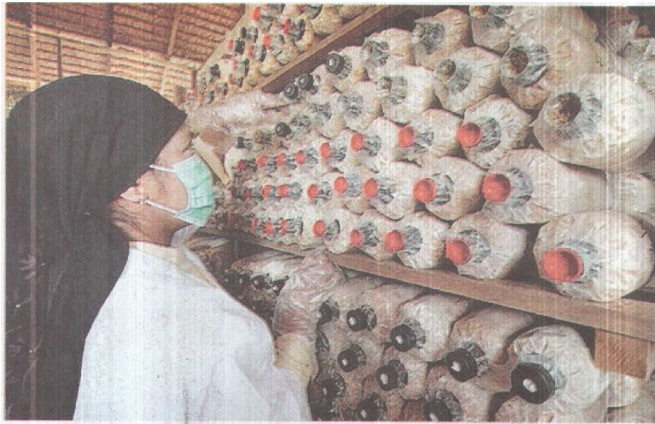
SEORANG pekerja memeriksa polibeg yang telah disuntik dengan benih cendawan.