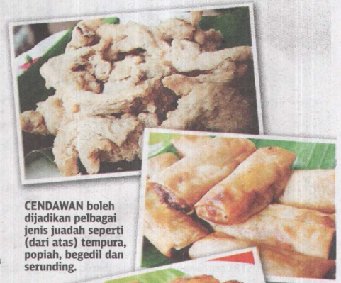
CENDAWAN boleh dijadikan pelbagai jenis juadah seperti (dari atas) tempura, popiah, begedil dan serunding.

Bagi mereka yang ingin mengetahui lebih lanjut mengenai industri cendawan boleh menghubungi Zainon di 013-341 8202.