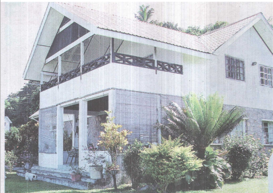
CANTIUK: Bekas rumah Sultan Abdullah yang dibuang ke Seychelles pada 1877, masih tersergam indah.