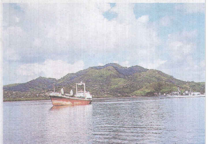
TENANG: Pulau Seychelles menjadi tumpuan pelancong.