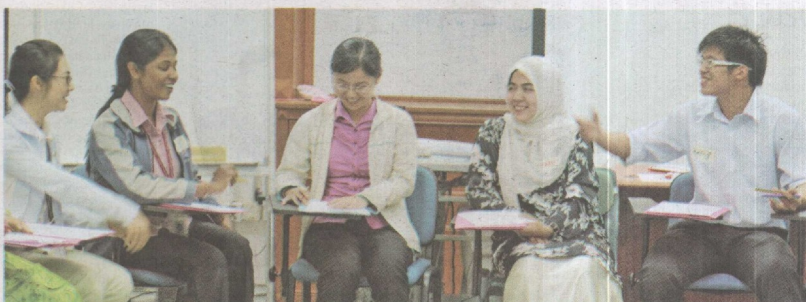
KERJASAMA: Peserta berbincang selepas diberikan tugas perlu diselesaikan dalam tempoh ditetapkan fasilitator.