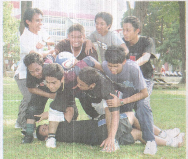
SEIMBANG: Selain akademik, modul Finishing School UPM menyertakan kegiatan luar.

"Dalam usaha penambahbaikan program berkenaan, kami menghantar 100 borang kaji selidik kepada majikan di seluruh negara bagi mendapat cadangan dan idea yang diperlukan majikan," katanya.