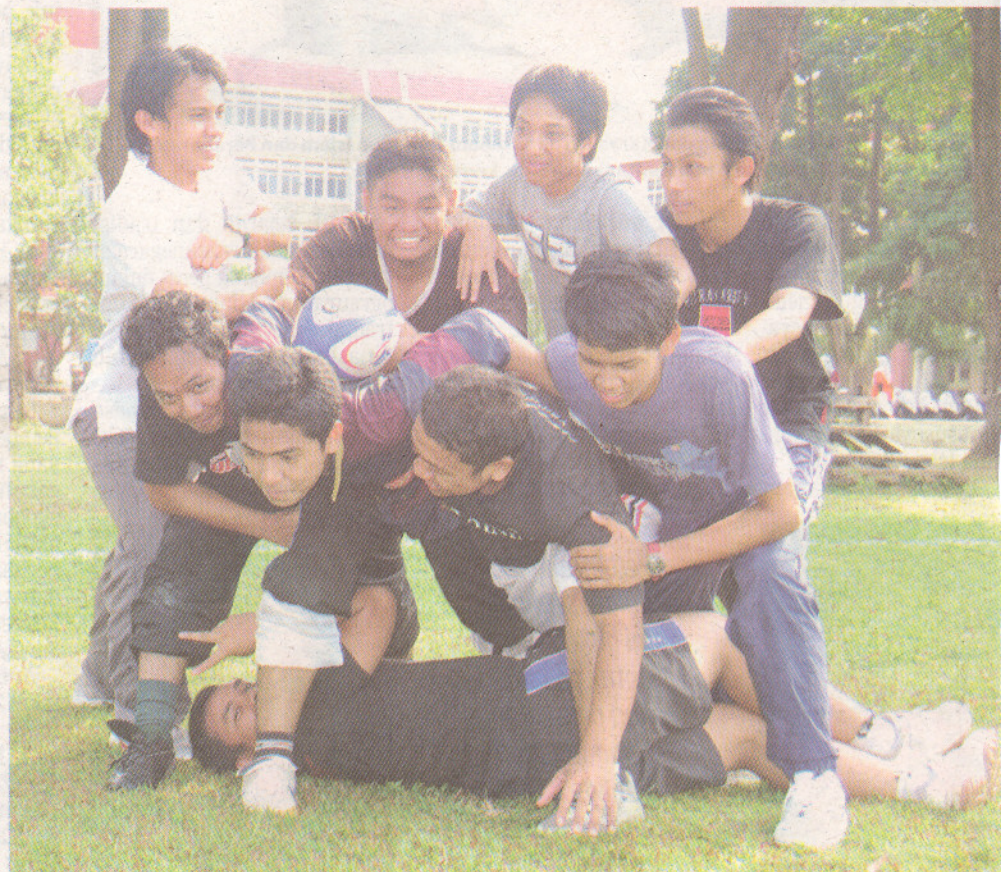
SEIMBANG: Selain akademik, modul Finishing School UPM menyertakan kegiatan luar.