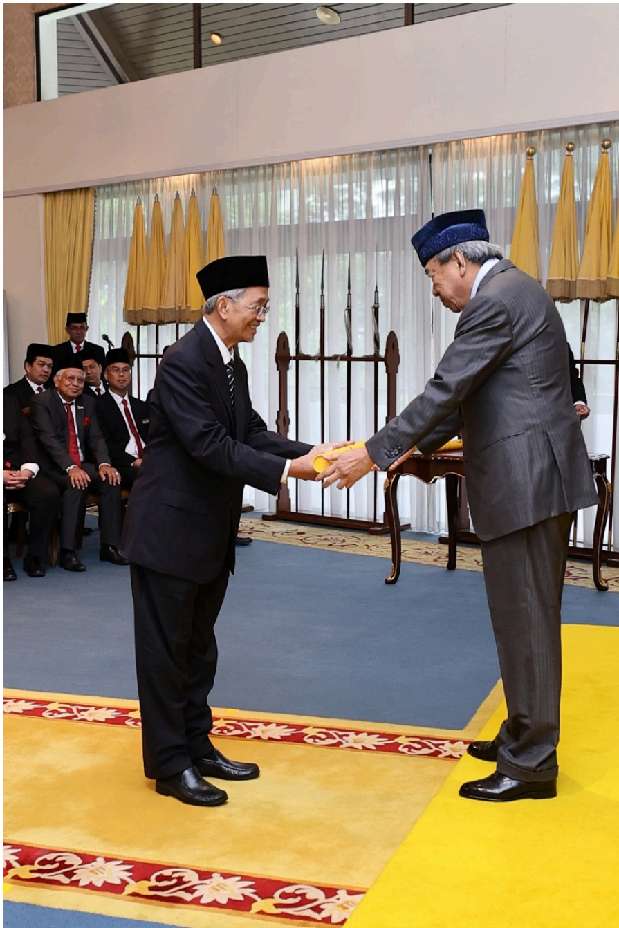
Pelantikan tersebut adalah untuk tempoh selama tiga tahun berkuat kuasa 18 Oktober 2024 hingga 17 Oktober 2027.