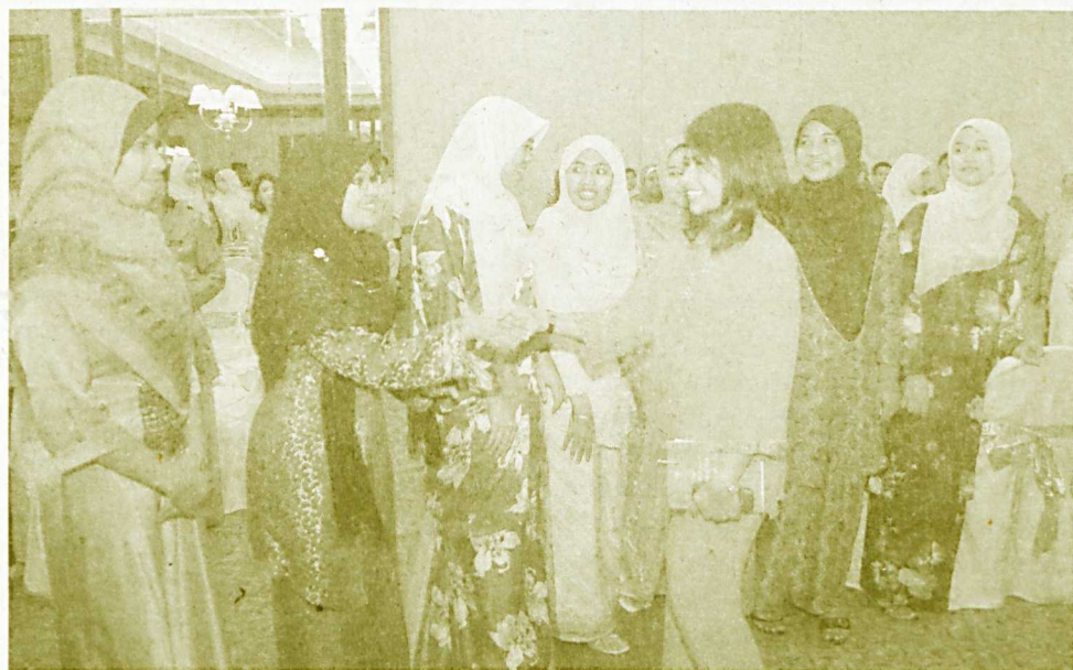
Kehadiran yang disambut meriah.