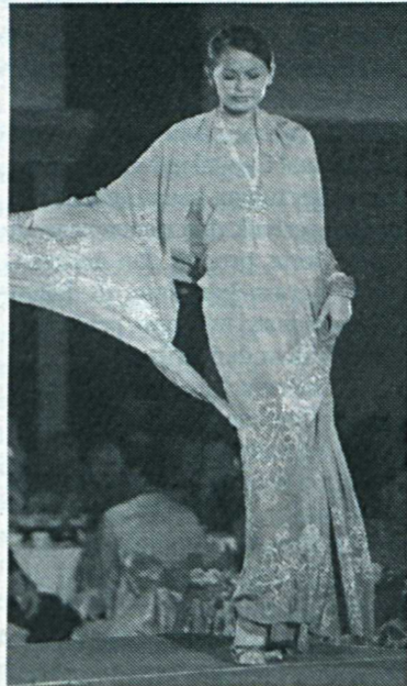
Acara pertunjukan fesyen batik turut diadakan.

universiti penyelidikan dan pembangunan, UPM membantu Makna menjalankan penyelidikan mengenai kanser dengan peruntukan daripada badan itu sebanyak RM1.6 juta. (petikan Berita Harian 28 Julai 2005)