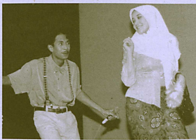
PIKAT...salah satu aksi menarik para peserta di malam pertandingan