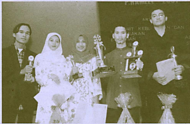
PARA pemenang malam Nostalgia P. Ramlee bersama hadiah masing-masing

ALLAHYARHAM Tan Sri P. Ramlee adalah satu nama yang besar dalam dunia seni tanahair. Setelah 28 tahun pemergianya, tokoh seniman tersebut sekali lagi diberi penghormatan oleh generasi muda khususnya golongan mahasiswa.