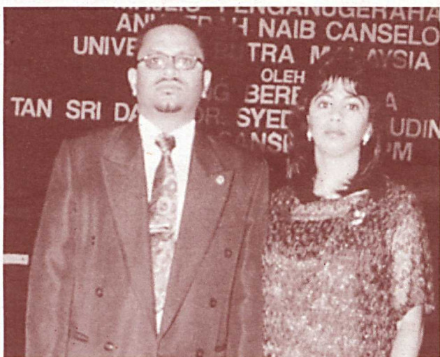
PENDORONG...isteri dianggap pendorong baginya untuk mencipta setiap kejayaan

awal sesuatu kerja akan mendatangkan hasil yang baik. Para pelajar perlu ada pakar rujuk khususnya para pensyarah dalam menentukan perancangan itu.