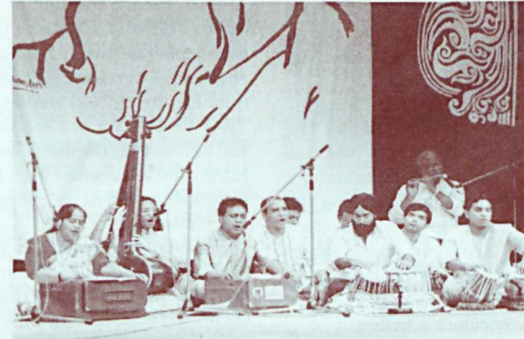
Singing and Dancing in Tagore's Praise of Humanity

It was a memorable moment for us as we danced into the hall filled with guests, to the singing of the choir. We interpreted the song with a wide range of hand and body movements. Clearly, the many hours of practice and preparation seemed worthwhile as we noticed the audiences' faces light up as we danced around them. The ap-