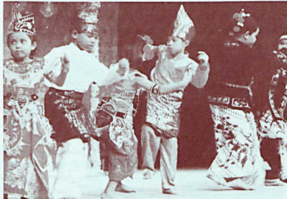
Anak-anak pelajar turut menjayakan majlis Malam Kebudayaan Indonesia

Saya sekali lagi mengucapkan Selamat Menyambut Hari Kemerdekaan Indonesia kepada pelajar-pelajar dari Indonesia di