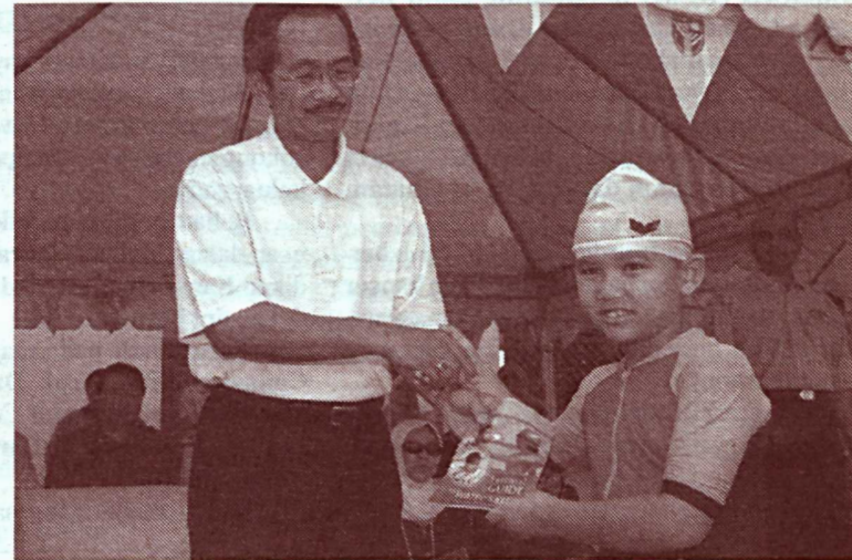
Naib Canselor melancarkan buku panduan keselamatan di air dalam satu majlis di Kompleks Renang UPM baru-baru ini.