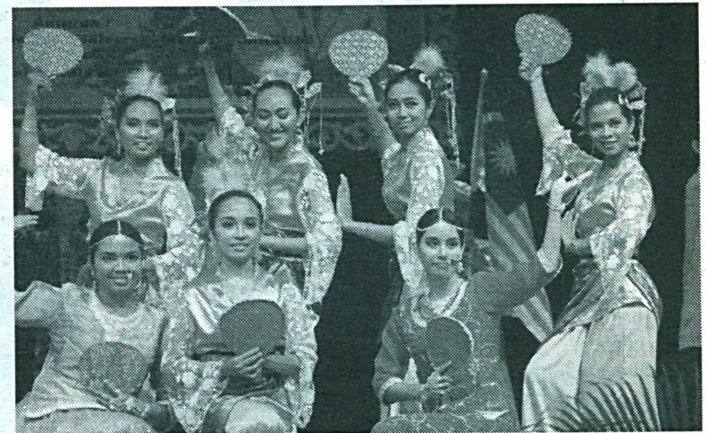
Tarian tradisional pelbagai kaum di Malaysia turut dipersembahkan.

Antara tetamu yang hadir, Timbalan Naib Canselor (Hal Ehwal Pelajar) UPM, Prof. Madya Dr.