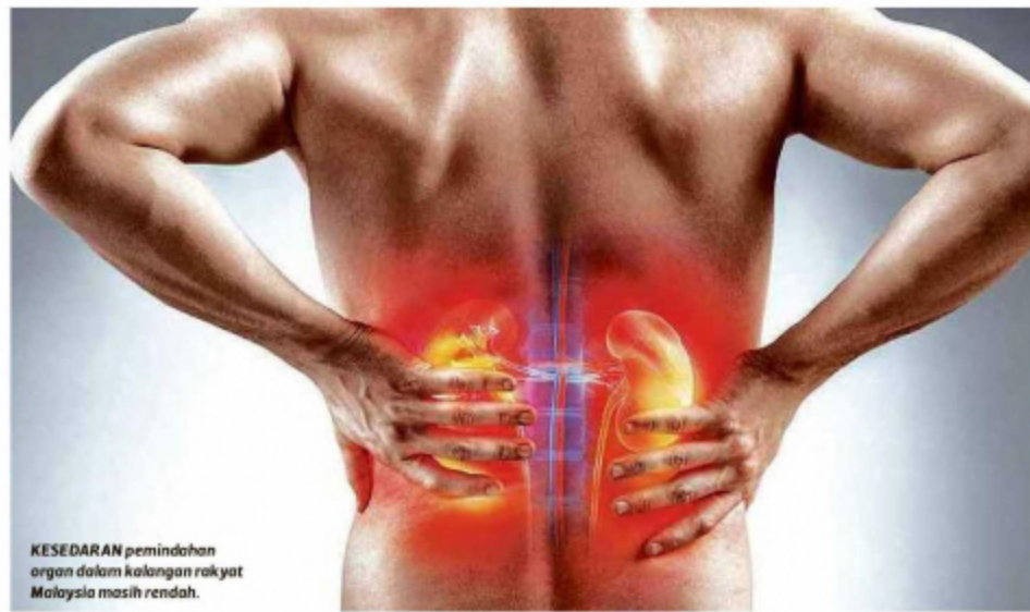
KESEDARAN pemindahan organ dalam kalangan rakyat Malaysia masih rendah.