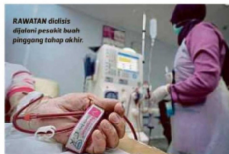
RAWATAN dialisis dijalani pesakit buah pinggang tahap akhir.