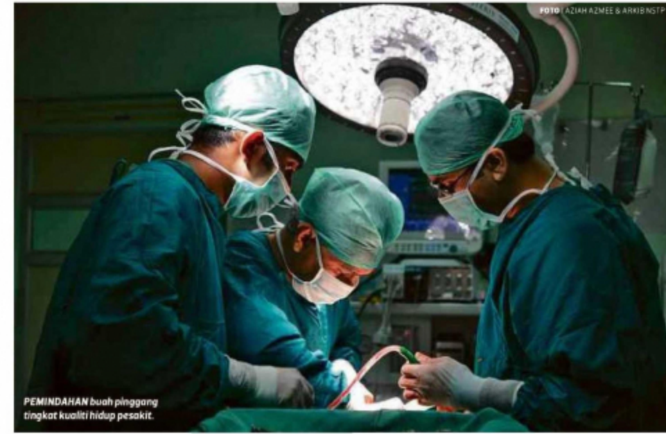
PEMINDAHAN buah pinggang tingkat kualiti hidup pesakit.

Stigma pemindahan organ dalam kalangan rakyat perlu diubah untuk bantu pesakit memerlukan