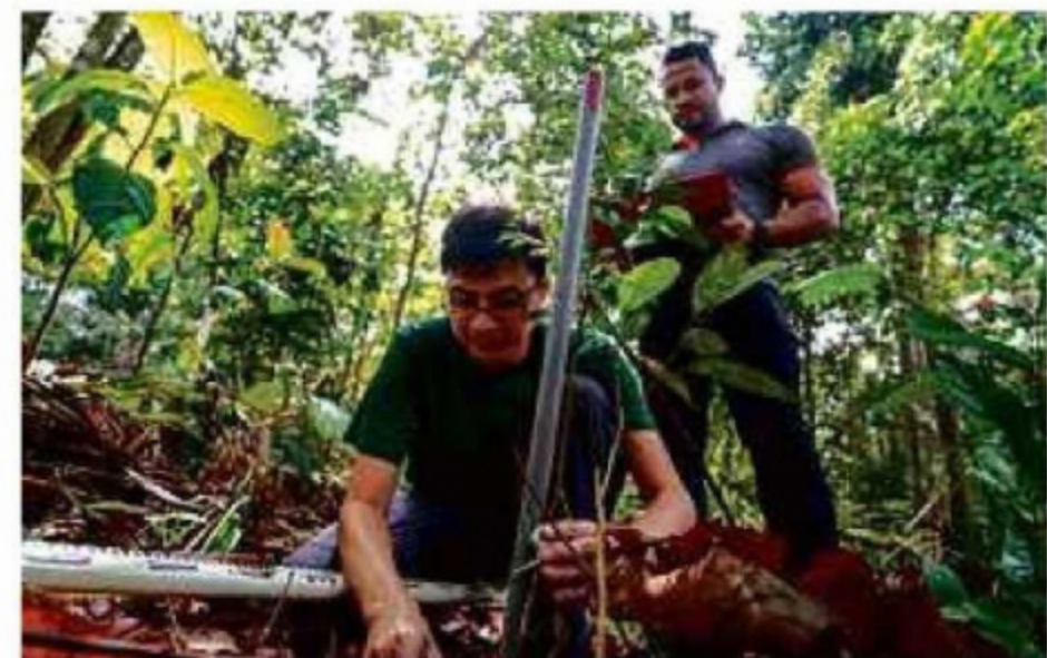
HUTAN Simpan Ayer Hitam lokasi kajian.

pembangunan yang tidak terkawal," katanya.