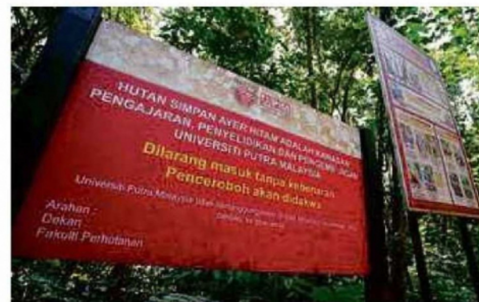
PAPAN tanda larang menceroboh.

"Paling bernilai ialah flora dan fauna endemik yang perlu dijaga bagi mengekalkan kepelbagaian biologi serta mengelakkan tanah terus diancam