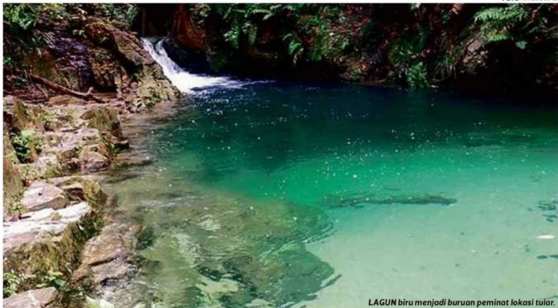
LAGUN biru menjadi buruan peminat lokasi tular.

"Kawasan lubuk kawah atau Blue Lagoon adalah