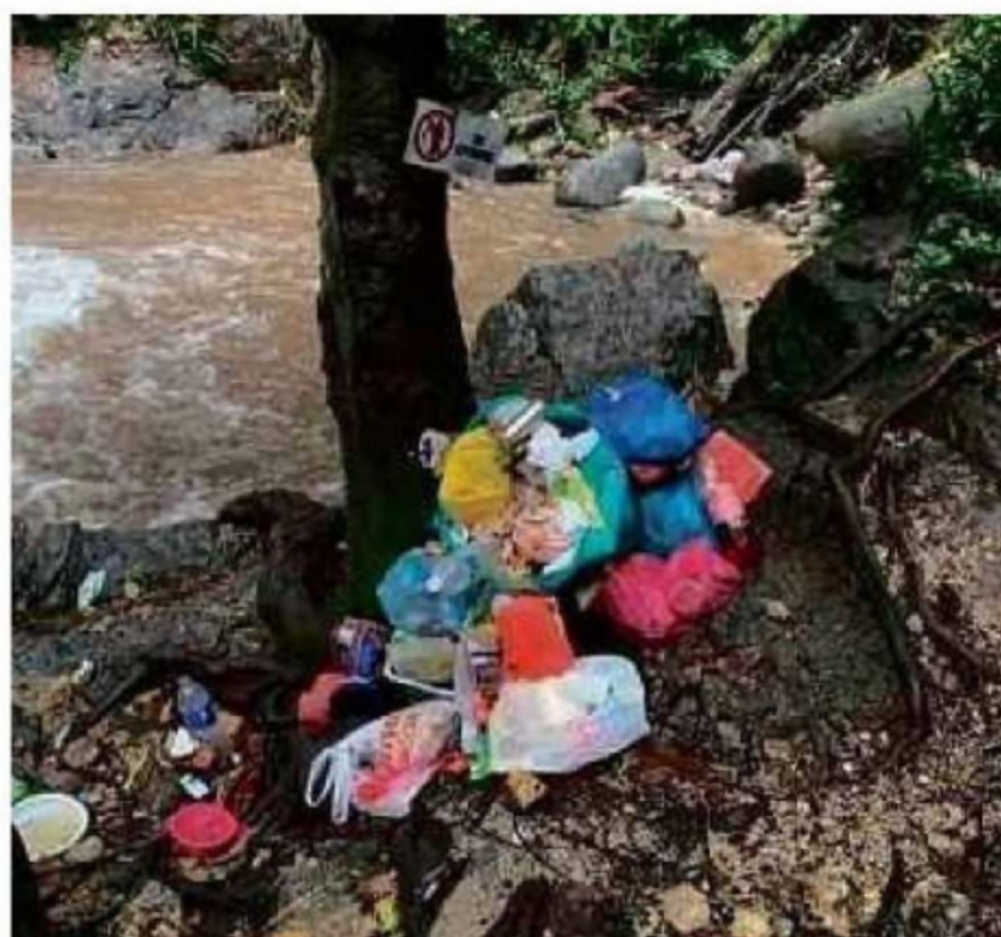
SAMPAH dan mencantas pohon kayu bernilai tinggi antara kesan pencerobohan hutan

permata tersembunyi HSAH, yang lebih dikenali orang ramai sebagai Wawasan Hiking Trail atau Kinrara Hiking Trail.