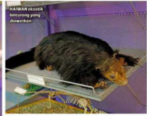
HAIWAN eksotik binturong yang diawetkan.