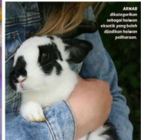
ARNAB dikategorikan sebagai haiwan eksotik yang boleh dijadikan haiwan peliharaan.