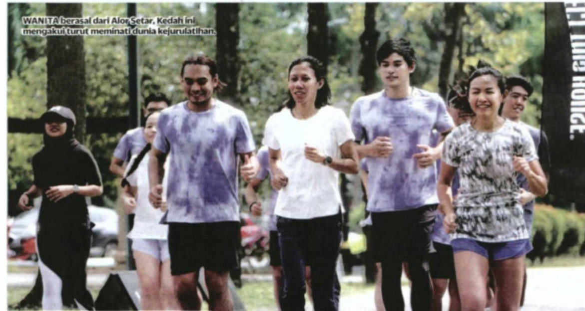
WANITA berasal dari Alor Setar, Kedah ini mengakui turut meminati dunia kejurulatihan.

sewaktu melakukan latihan mengangkat berat di gimnasium dan perlu melakukan pembedahan.