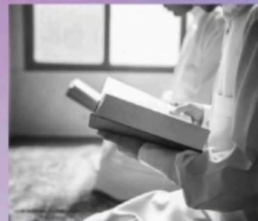
Bangun malam dengan membaca al-Quran antara amalan yang digalakkan.

"Teruskan berdoa, berzikir dan berselawat serta bersedekah. Malah,