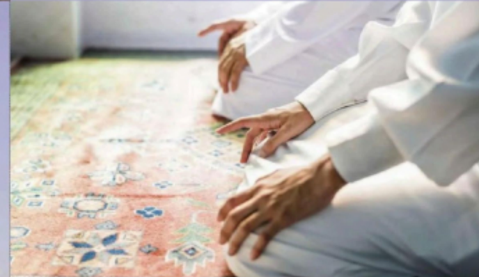
Istiqamah mendirikan solat sunat tawarikh dan witr secara berjemaah antara amalan yang diganjar pahala qiam.

"Tidak mengapa jika lampu pelita ditukar dengan lampu moden. Apa yang penting, budaya iktikaf di masjid atau surau pada 10 malam terakhir Ramadan digiatkan. Ini tujuan asal. Selain itu, budaya bertukar-tukar makanan atau bersedekah makanan perlu dihidupkan," tuturnya mengakhiri bicara.