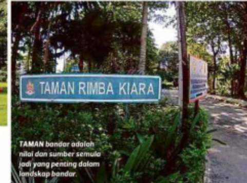
TAMAN bandar adalah nilai dan sumber semula jadi yang penting dalam landskap bandar.

bersifat semula jadi serta taman oriental dari timur seperti China dan Jepun.