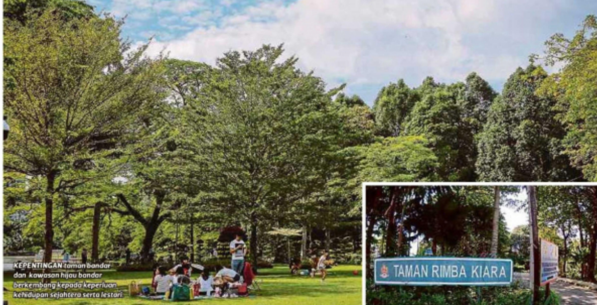
KEPENTINGAN taman bandar dan kawasan hijau bandar berkembang kepada keperluan kehidupan sejahtera serta lestari.

Jadi kawasan pembangunan hilang nilai semula jadi, hasilkan kualiti landskap buatan manusia yang pelbagai