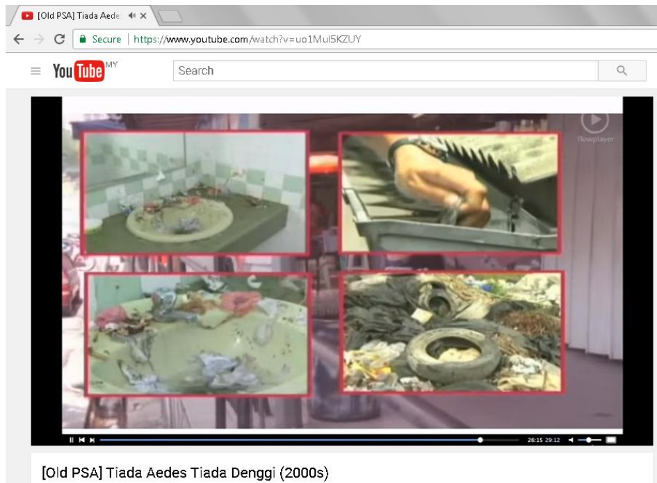
Rajah 1.1 : Klip Video Cegah Nyamuk Aedes

yang tersumbat. Paparan tersebut membawa mesej kepada penonton bahawa itulah hakikat sebenar amalan dan tingkah laku masyarakat terhadap kawasan persekitaran seperti dalam Rajah 1.1.