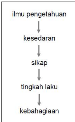
Rajah 1.2 : Transitif Kemanusiaan

Sebelum diteruskan menyentuh kepada konsep dan teori, pengkaji 5 mencadangkan satu carta alir kemanusiaan. Carta alir kemanusiaan tersebut bertujuan supaya pembaca lebih mudah memahami tahap kemanusiaan yang dibincangkan dalam melihat kajian ini. Pengkaji mencadangkan carta alir kemanusiaan tersebut dengan sebutan transitif kemanusiaan. Cadangan transitif kemanusiaan adalah seperti dalam Rajah 1.2 berikut.