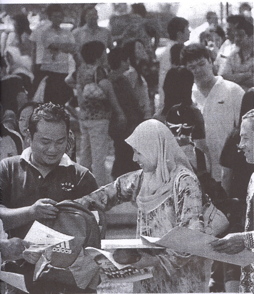
KAKITANGAN Pusat Kesihatan UPM memberi borang ujian saringan H1N1 kepada pelajar baru semester pertama sesi 2009 dan 2010.

K UALA LUMPUR: Beberapa pa institusi pengajian tinggi awam (IPTA) mewajibkan ujian saringan selesema babi (H1N1) kepada pelajar baru ketika sesi pendaftaran bagi memastikan wabak itu tidak merebak di kalangan warga kampus.