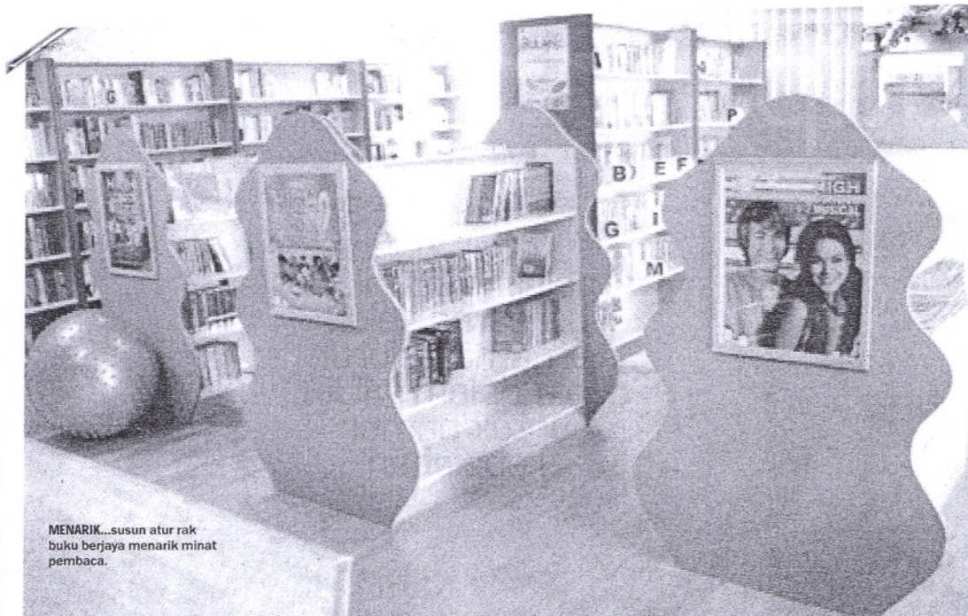
MENARIK... susun atur rak buku berjaya menarik minat pembaca.