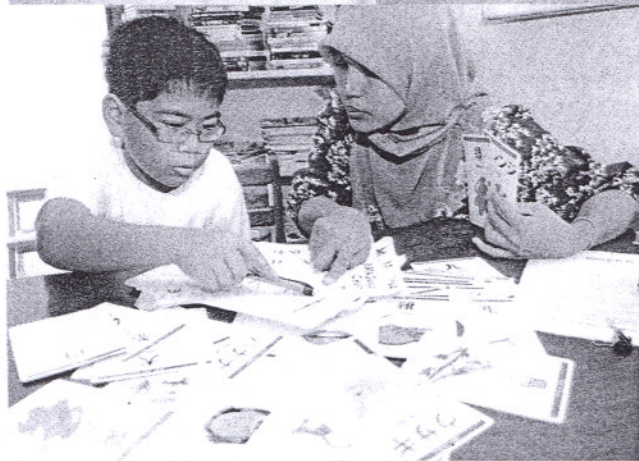
AJAR... mengadakan kelas tuisyen bahasa Jepun untuk murid sekolah rendah.

Katanya, pembaca boleh melanggan pakej disediakan dengan bayaran tertentu secara bulanan dan buku yang dipesan akan dikirim kepada pembaca dengan menggunakan perkhidmatan Pos Laju. "Bayaran dikenakan termasuk kos penghantaran. Kami menjalin kerjasama dengan Pos Malaysia bagi memulihkan proses penghantaran buku yang dipesan. "Apabila pelanggan mahu memulangkan semula buku, mereka hanya perlu meletakkan kepada kami dan dengan menggunakan Pos Malaysia akan