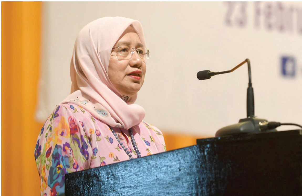
By Azman Zakaria

“Only with prosperity, we are able to work, serve and contribute towards a more sustainable development of UPM” - NC