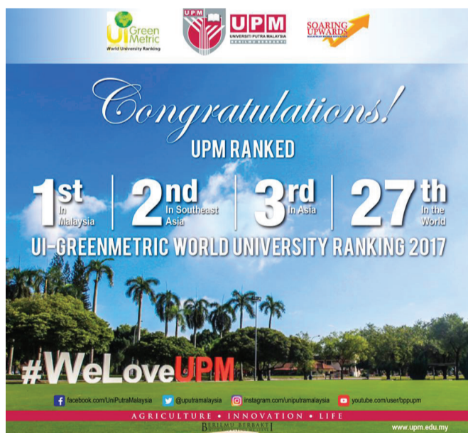
By Khairul Anuar Muhamad Noh

SERDANG, Dec 14 - Universiti Putra Malaysia (UPM) made history once again in the country when it was listed as the world’s top 27, according