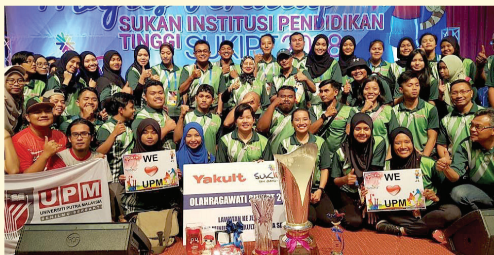
By Khairul Anuar Muhamad Noh

BANGI, Feb 10 - Universiti Putra Malaysia (UPM) emerged as the overall champions of the 2018 Institutions of Higher Learning Games (SUKIPT) for the second time since it won the first SUKIPT in 2012.