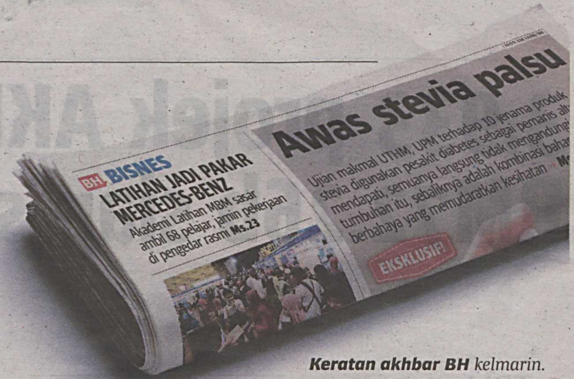
Keratan akhbar BH kelmarin.

Kelmarin, Ketua Pengarah Kesihatan, Datuk Dr Noor Hisham Abdullah, berkata Peraturan 118A