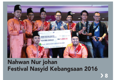
Nahwan Nur johan Festival Nasyid Kebangsaan 2016