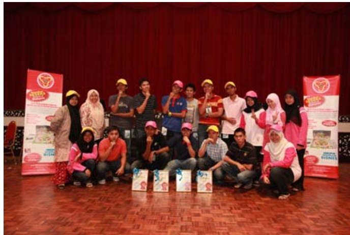
Para pemenang yang berjaya mengaut keuntungan dalam catur bistari.

Beliau yang juga Timbalan Presiden, Dewan Perdagangan Islam Malaysia berkata jihad bisnes menerapkan tiga strategi utama iaitu membina satu empayar besar dalam bisnes, membina satu jenama besar yang disegani di samping menyebarkan ilmu bisnes yang sebenar mengikut cara Islam.