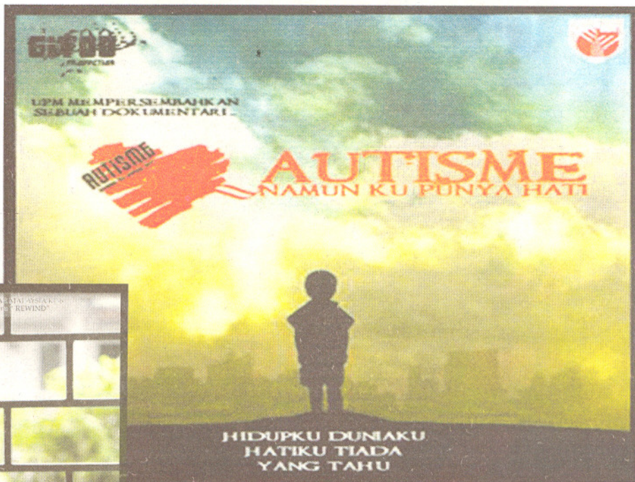
REWIND dan Autisme: Namun Ku Punya Hati antara naskhah yang memeriahkan FFVPM6.

Sesuatu yang memberangsangkan juga adalah peningkatan ketara yang dapat dilihat menerusi penyertaan pelajar yang mencapai angka 310 penyertaan merang-