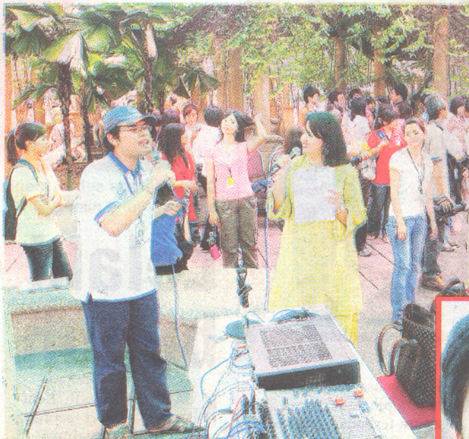
CURI TUMPUAN...gelagat juruhebah Putra FM mencuit hati pelajar.

"Putra FM sudah wujud sejak tujuh tahun lalu, namun sehingga kini masih ramai tidak menyedari ke-