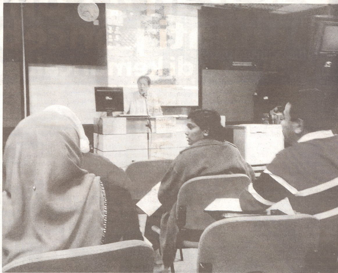
ANTARA pelajar PJJ mengikuti pengajian secara bersemuka.

pesara yang mahu meningkatkan ilmu pengetahuan," katanya.