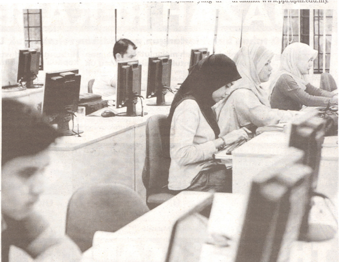
PELAJAR PJJ mengikuti kuliah menerusi sidang video di pusat Pendidikan Jauh Jauh UPM, Kuala Lumpur.