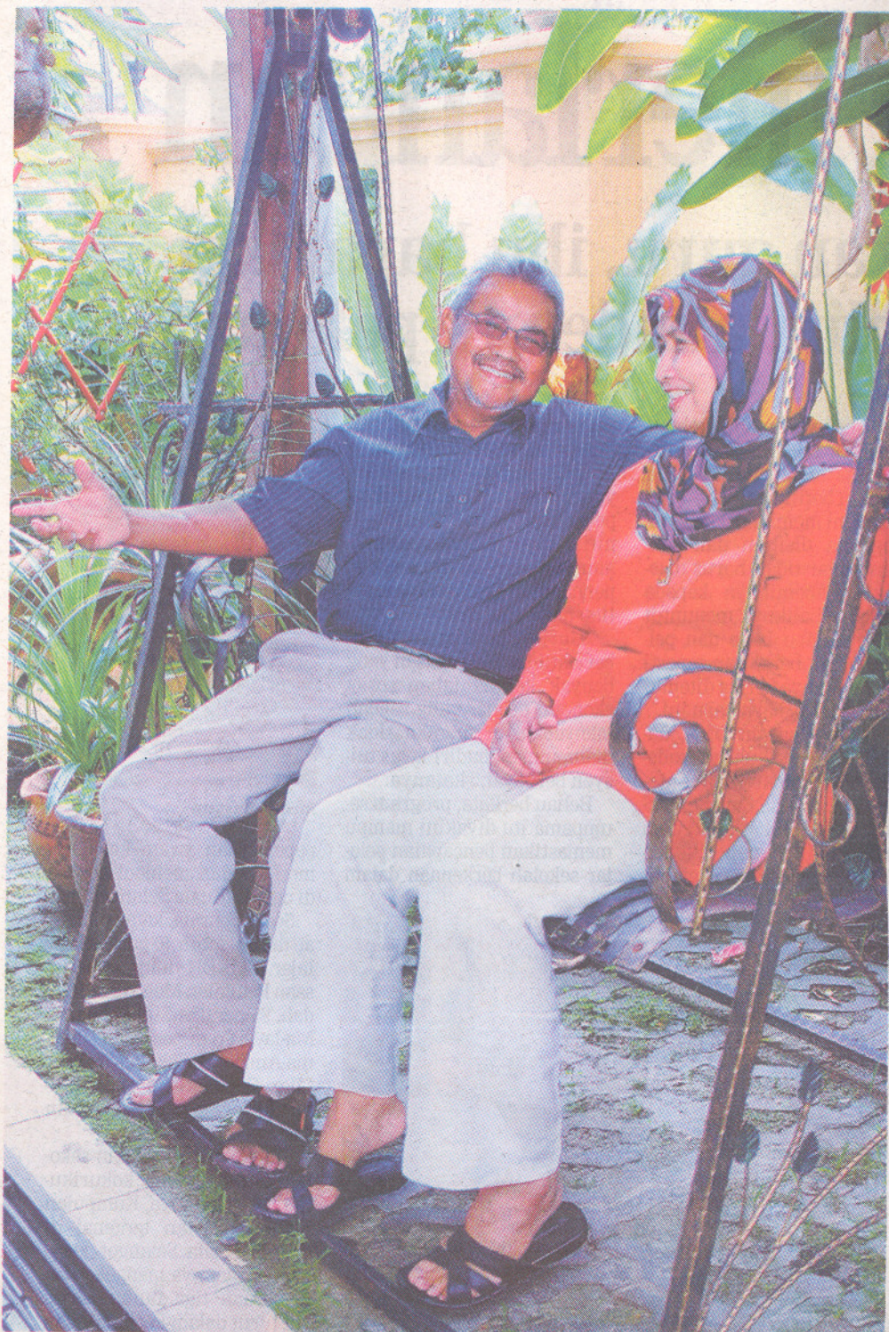
KINI lebih banyak masa dihabiskan bersama isteri tercinta yang banyak memberi semangat untuk melawan penyakit barah.