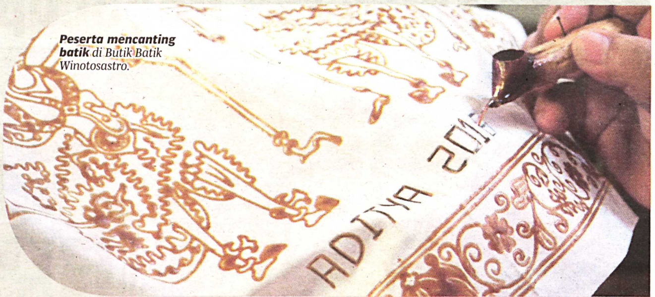
Peserta mencanting batik di Butik Batik Winotosastro.