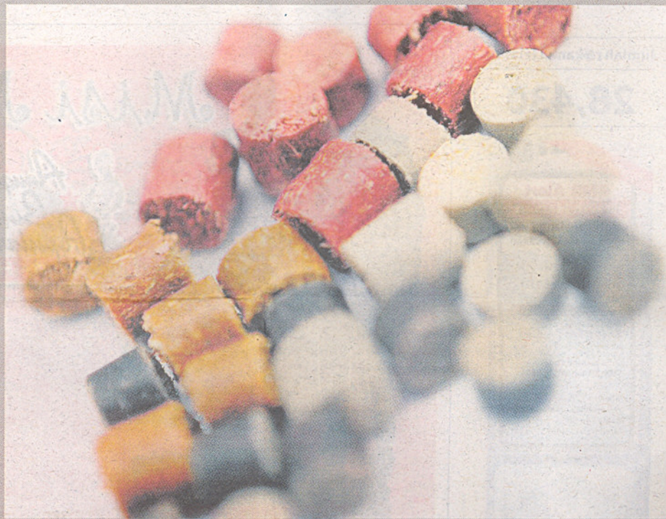
RUPA palet kenaf selepas diproses.